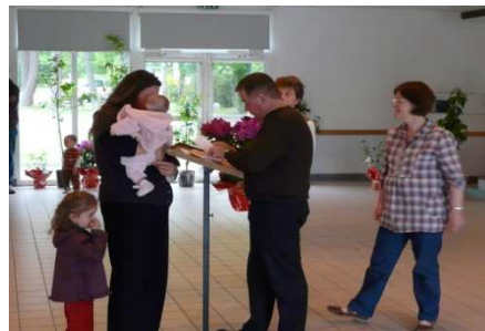
Les élus ont honoré les nouveaux citoyens

C'est une coutume qui a traversé les âges : planter un arbre pour célébrer la naissance d'un bébé. Un geste, chargé d'espoir et de symboles. Pour l'arbre comme pour l'enfant, c'est la vie qui commence. Au fil du temps et des saisons, tous deux vont se nourrir, grandir et se développer. Chacun à son rythme et en parfaite harmonie.