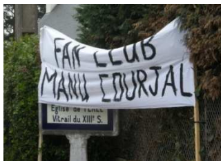
Un jeune spectateur enthousiaste .....et des supporters confiants