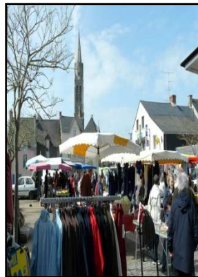
Un début prometteur

Samedi 16 Mai, effervescence dans le bourg de Férel. Dès 7 heures, les étals se mettent en place pour accueillir les clients du 1 er Marché Férelais. La place s'est progressivement remplie, d'acheteurs et de curieux.