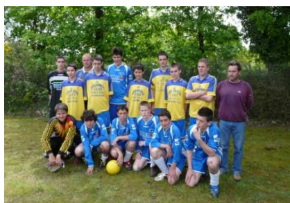
Assérac+ Foot-Sud Vilaine, une association qui gagne

Malgré les pronostics pessimistes des météorologues, c'est sous un soleil généreux que s'est déroulé le traditionnel tournoi du FC Sud Vilaine au stade de Férel. Et c'est tant mieux car les spectateurs ont ainsi pu assister à des rencontres de qualité.