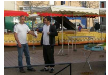
L'initiateur du marché ( à gauche, )

Le panier garni a été gagné par M. AVERTY d'Herbignac